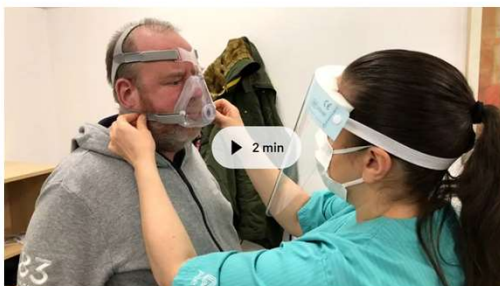
Hur har mottagningen lyckats beta av värdköen? Få svaret i videon.

Drygt 50 000 patienter i Stockholms län lider av andningsuppehåll under natten, så kallad sömnapné. För bara 1,5 år sedan stod 7 000 personer i kö för att få vård. Trots pandemi och hård kritik från både patienter och läkare har den nya sömnapné-mottagningen i Stockholm, som startade 2020, lyckats beta av kön.